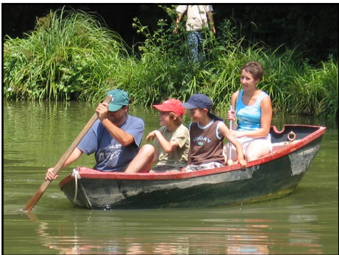
La Communauté de Communes du Plateau du Vexin, partenaire depuis 2005

La vocation de notre association est d'accompagner nos partenaires dans la préparation et la réalisation d'actions de loisirs en direction des enfants et des jeunes.