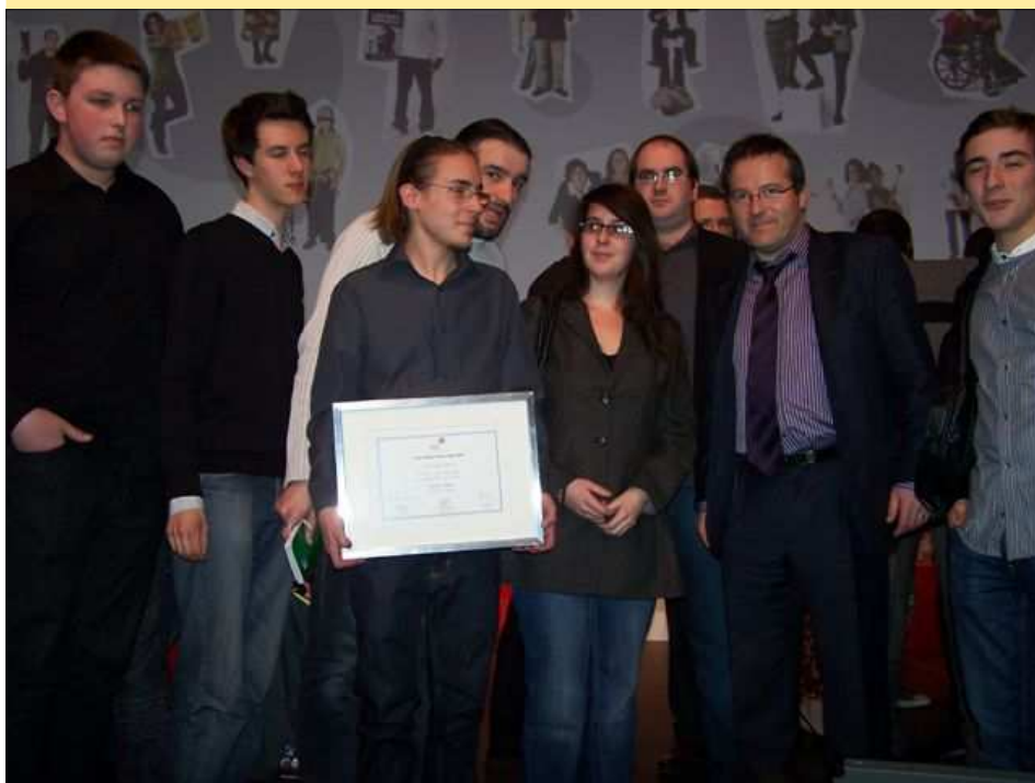
Vendredi 30 janvier 2009. A Paris. Toute l'équipe d'Oxyradio reçoit des mains de Martin Hirsch, Haut commissaire chargé de la jeunesse, le premier prix du Jury.