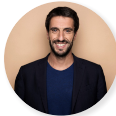
TONY ESTANGUET, Président des Jeux de Paris 2024