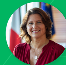
ROXANA MARACINEANU, Ministre des sports